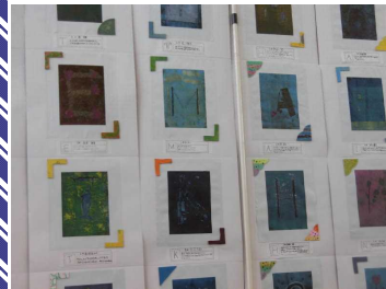
【5年】 (平面作品) 色を重ねて 一版多色刷り版画