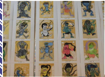
【3年】 (平面作品) わたしのかみなりさま