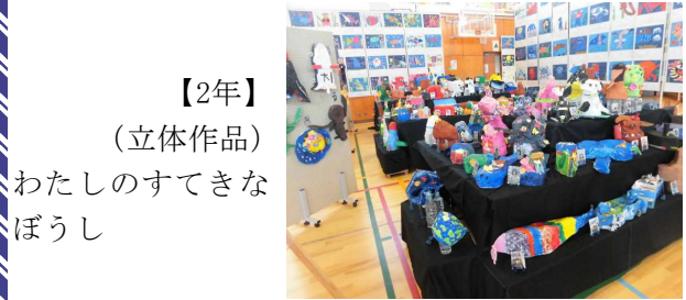
【2年】 (立体作品) わたしのすてきなぼうし