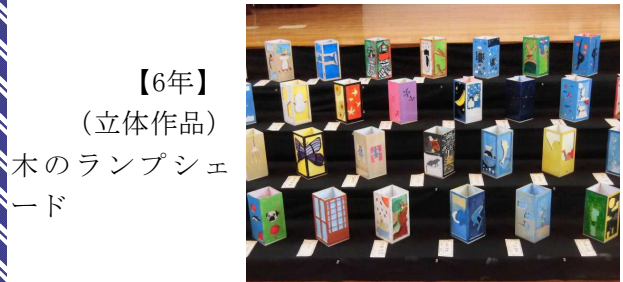
【6年】 (立体作品) 木のランプシェード