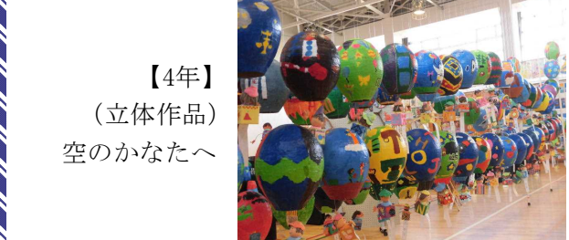
【4年】 (立体作品) 空のかなたへ