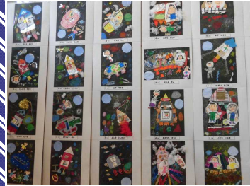
【1年】 (平面作品) うちゅうへいこう

体育館に展示された約2000点の作品。どれも個性溢れる素晴らしい作品ばかり。一生懸命考え、作業した様子が作品を見てうかがえます。